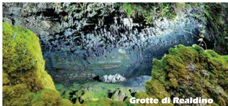
Grotte di Realdino