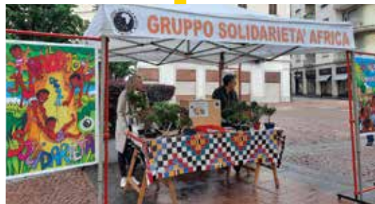
I bonsai nelle piazze di Seregno

Bella occasione di incontro nelle piazze di Seregno la prima domenica di maggio, con presentazione del progetto "Salute al femminile" per la prevenzione, diagnosi precoce e cura dei tumori femminili. I bonsai proposti agli amici e sostenitori ricordano i grandi baobab che in Africa subsahariana sono punto di aggregazione, discussione e decisioni nei villaggi della savana dove il GSA testimonia l'impegno di tanti amici per garantire la dignità di ogni persona.