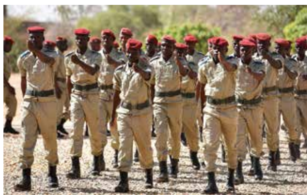
Truppe scelte: pericoloso fiore all'occhiello per molti regimi in Africa

Già questo contesto sarebbe più che sufficiente per convincere chiunque a fug-