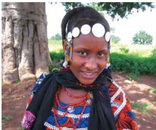
Prevenzione del tumore dell'utero nei villaggi del nord Bénin

Tutte le realizzazioni descritte in queste pagine sono possibili grazie a tanta gente che lavora in silenzio e con... generosità. Grazie!