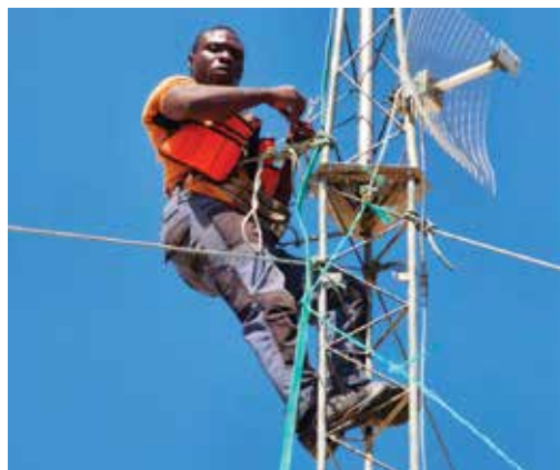
Allestimento dei parafulmini all'ospedale di Afagnan