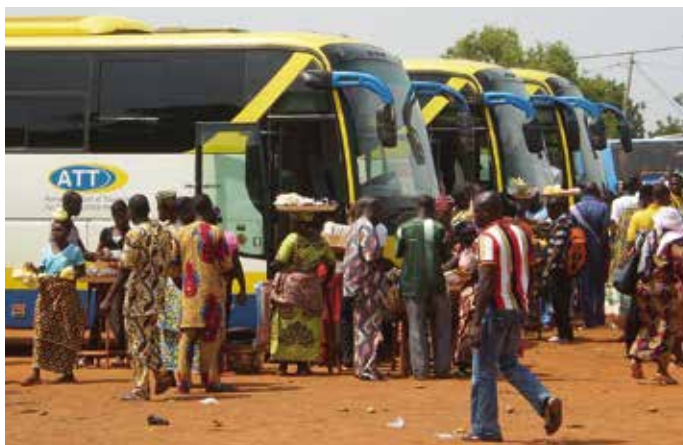
Cotonou: partenza per Tanguiéta