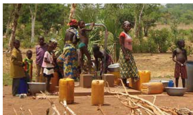
"... il diritto alla salute"

Conclusi "in qualche modo" gli otto obiettivi del millennio, proposti ma non raggiunti per il 2015, è stata subito lanciata "Agenda 2030" con la posta più che raddoppiata: da 8 a 17! Sembra proprio un casinò: più si perde e più si gioca! E, guarda caso, il primo obiettivo è riproposto in pompa magna: se prima era "lotta alla povertà estrema" ora è diventato "lotta alla povertà" ... e in Italia siamo già avanti perché la povertà l'abbiamo abolita per decreto.