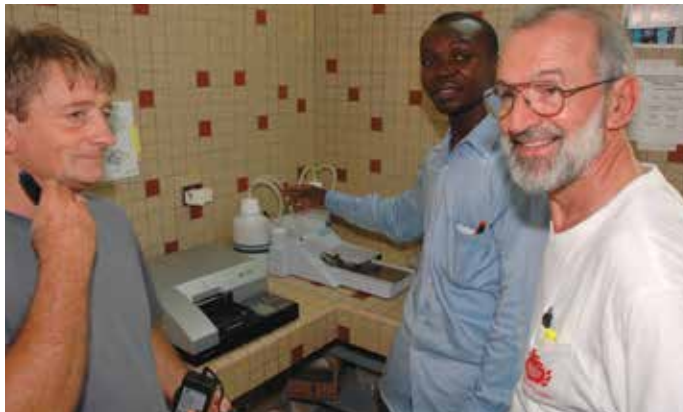
Il laboratorio analisi a Afagnan

Il Laboratorio è determinante per la corretta gestione delle diagnosi e delle terapie dei malati che affluiscono in ospedale da tutto il sud del Togo ma anche dal confinante Bénin.