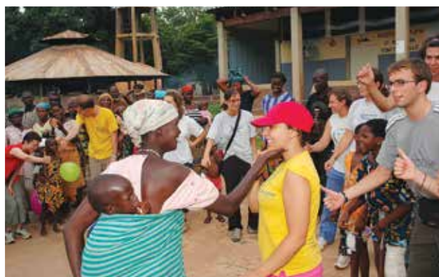
Giovani volontari di Seregno in Bénin

È maturo il tempo in cui la società civile, che si riflette in gran parte in quello che è chiamato "Terzo settore", diventi consapevole dell'importanza del suo ruolo per la costruzione di un mondo dove il bene comune e la dignità di ogni persona siano i cardini dell'umana convivenza.