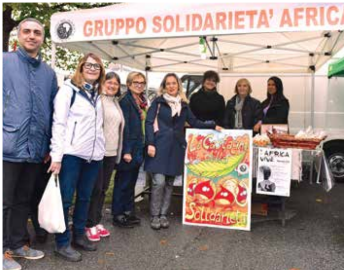
Castagne della Solidarietà 2023

Abbiamo incontrato tanti amici vecchi e nuovi nelle giornate delle caldarroste in occasione della visita al cimitero di Seregnò per la Commemorazione dei defunti. Alpini e Camosci hanno lavorato con i soci GSA per offrire castagne e pane dei morti in condivisione e sostegno dei progetti sanitari in Africa. Apprezzata come sempre l'iniziativa che permette il finanziamento del progetto "Salute al femminile" per la prevenzione del tumore del collo dell'utero nella popolazione femminile del Nord Bénin che gravita sull'ospedale di Tanguiéta.