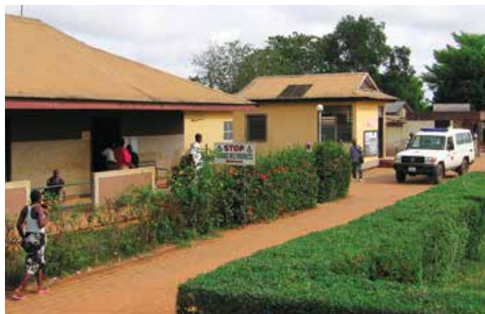
Pronto Soccorso dell'Ospedale di Afagnan

Afagnan: con la generosità del Natale contiamo di chiudere il progetto di riqualificazione delle sale operatorie. Un nuovo impegno ci viene proposto per uno straordinario progetto di formazione del personale con particolare attenzione a quello dell'ambito emergenza-urgenza. L'obiettivo è ambizioso e di primaria importanza: cerchiamo sponsor, ma dovremo anche lavorare con risorse interne al