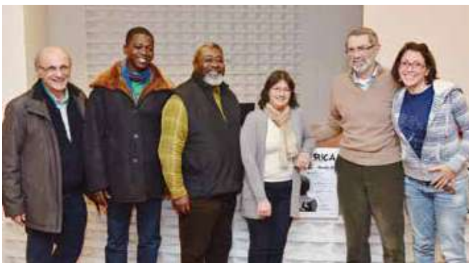
Kossi Komla Ebri, medico togolese, antropologo e scrittore