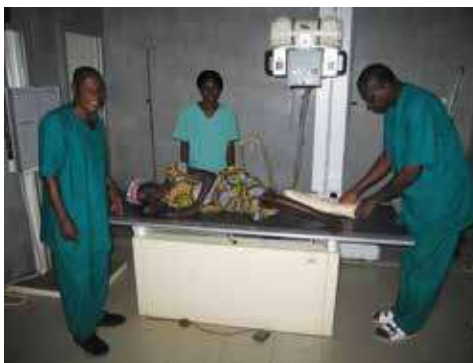
In Radiologia ad Afagnan

AFAGNAN: in funzione la termoculla da poco inviata in Ospedale, sono in partenza i monitor e i kit di rianimazione pediatrica per una necessaria riqualificazione dell'assistenza pediatrica nell'ospedale che è centro di riferimento per tutta la regione marittima del Togo. Con il susseguirsi delle missioni delle giovani biologhe del gruppo di Serena Cavallari è ormai stabilizzata e certificata l'efficienza del laboratorio di microbio-