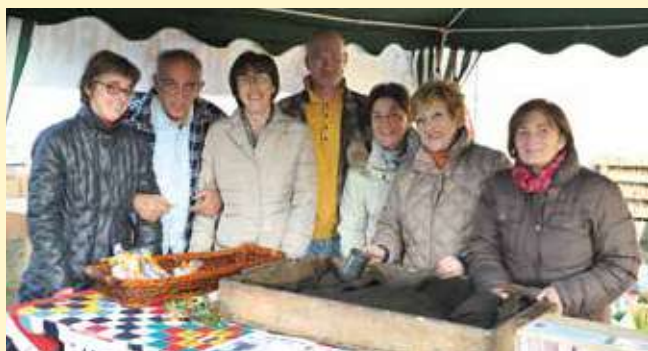
Castagne della solidarietà: il Gruppo Camosci

Sempre vivace la postazione delle caldarroste del GSA sul piazzale del cimitero di Seregno con la partecipazione di Alpini e Camosci; quest'anno è andato a ruba anche il gustosissimo pane dei morti.