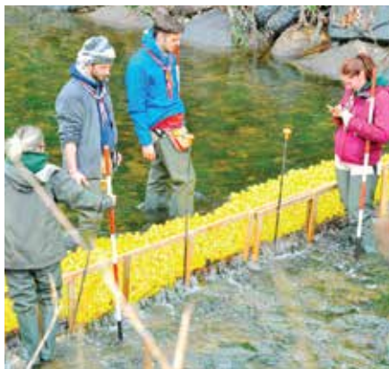
Paperelle alla partenza

Il pomeriggio di domenica 2 aprile ci vede sulle sponde del fiume Seveso a Cesano Maderno con i Bersaglieri alla partenza della regata delle paperelle alle ore 16.00. La collaborazione con i Lions Club Seregno AID e Cesano Maderno Borromeo ci permette di vivere un pomeriggio di festa e di solidarietà con la lotteria il cui ricavato entrerà nel finanziamento per le attività di cooperazione di ciascuno dei tre promotori.