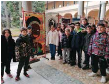
Ragazzi in visita alla mostra

La mostra con le brillanti tavole illustrate da Maria Silva sta completando il giro nelle scuole dei Seregno. Moltissimi alunni hanno potuto visitarla e prendere spunto, con i loro insegnanti, per la partecipazione al concorso "Collane per la regina" che si concluderà con la premiazione delle opere realizzate dai ragazzi ed esposte in sala mons. Gandini dal 1 al 4 giugno prossimi.