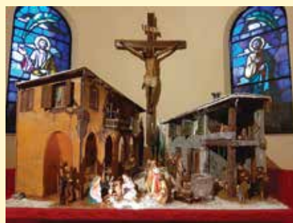
Presepe nella basilica di S. Ambrogio a Milano

Fantastico l'impegno del "gruppo presepi" riuscito a trovare tempo e spazi nella giungla delle limitazioni negli spostamenti. Incoraggiante il contributo raccolto, prontamente destinato al progetto "Chiamata d'urgenza: pronto soccorso" per la realizzazione del nuovo Pronto Soccorso a Tanguéta in Bénin.