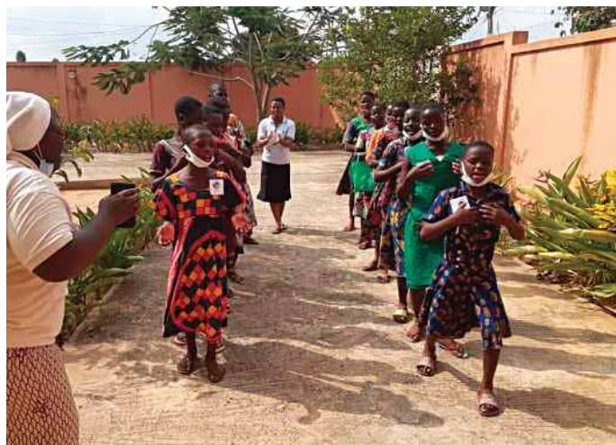
Ragazze al centro di accoglienza di Afagnan

Tanguiéta: prosegue il programma di "Adozioni sanitarie" per bambini e ragazzi con problemi di malattie croniche invalidanti in famiglia. Le suore Teatine garantiscono il supporto in numerose situazioni critiche che, a causa di malattie dei genitori, potrebbero ridurre i bambini allo stato di "ragazzi di strada" o schiavi agricoli. Il supporto economico del GSA è attribuito in rapporto alle effettive difficoltà del contesto familiare, limitatamente al tempo necessario a risolvere i periodi di crisi. In ospedale sono in corso i lavori per l'installazione della nuova autoclave che permetterà di migliorare la sicurezza in sala operatoria con assoluta garanzia di sterilità per il materiale e la strumentazione chirurgica.