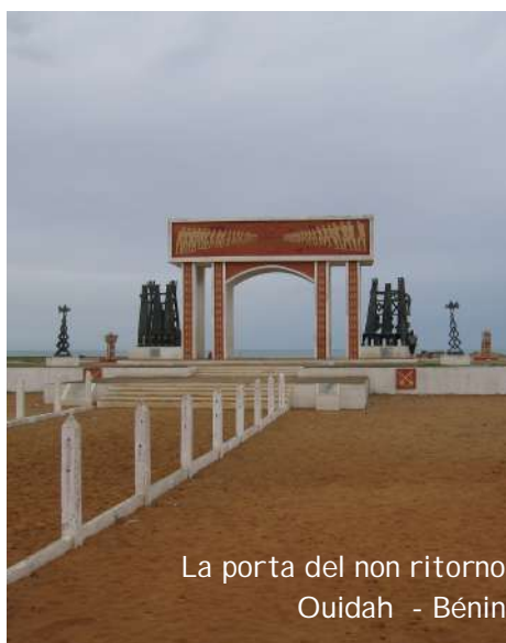
La porta del non ritorno Ouidah - Bénin

Nel contesto generale della globalizzazione il dialogo politico-istituzionale tra Europa e Africa non può prescindere dal superamento dei nazionalismi e dal confronto culturale. gsa