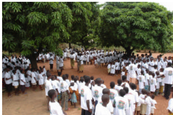
Si organizzano le squadre per i giochi