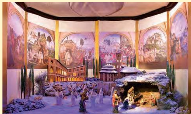
Un particolare del presepe arabo e il presepe in Abbazia

Siamo stati presenti anche al Museo dei Vignoli a Seregno con un presepe arabo, mentre a Milano i nostri presepi sono stati ospitati dalle Basiliche di S. Ambrogio e di Santa Maria alla Fontana. In tutti i casi i contributi dei visitatori sono stati attribuiti al progetto "Operazione riuscita!" per la ristrutturazione delle sale operatorie dell'Ospedale di Afagnan in Togo.