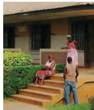
L'ingresso dell'ospedale di Tanguiéta

A Tanguiéta non mancano le situazioni critiche legate al continuo sovraffollamento dell'ospedale che rende ancora più alto il rischio di diffusione di SARS-CoV-2 che è in agguato nei territori vicini. Sicura la sua presenza in Burkina Faso, Niger e Nigeria così come in alcune zone del Bénin. La scarsissima disponibilità di test diagnostici e l'impossibilità di imporre politiche di isolamento rende praticamente impossibile arginare una epidemia che potrebbe mettere in serio pericolo la sopravvivenza di intere popolazioni.