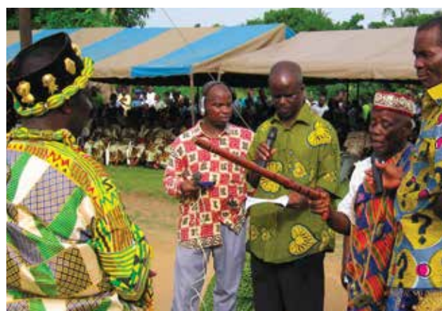
Costa d'Avorio - Cambio delle generazioni

Una umanità che si trova terribilmente impotente e spaventosamente sola, una umanità piegata dalla potenza di un virus. Una drammatica lezione contro lo strapotere della tecnologia, contro l'idea che solo l'uomo è padrone, contro la convinzione che solo la ricchezza genera felicità. Sono le esperienze e le sensazioni vissute in questi mesi che non sembrano avere una fine in un tempo che sembra scivolarci tra le mani come polvere che non riusciamo a contenere. Come vivere questo tempo che ci sembra "sospeso"? Abituati a padroneggiarlo come fosse un nostro possesso lo abbiamo sempre organizzato secondo la nostra