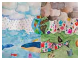
2 a CLASSIFICATA