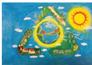
1 a CLASSIFICATA