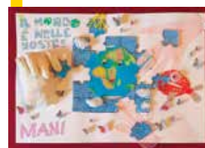
3 a CLASSIFICATA

Il GSA proporrà, appena possibile, un momento di festa con le premiazioni del concorso.