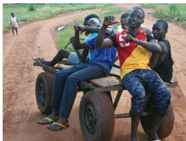
Sulle strade dell'Atakora in Bénin

Il "rumoroso" manifestarsi di queste sensibilità nelle generazioni più giovani costringe anche gli adulti ad anteporre ideali e sogni al bieco interesse immediatamente monetizzabile. L'enciclica "Laudato si" di papa Francesco ha sicuramente costituito un punto di riferimento morale sul quale confrontarsi a prescindere dalle proprie esperienze religiose e dal proprio percorso culturale.