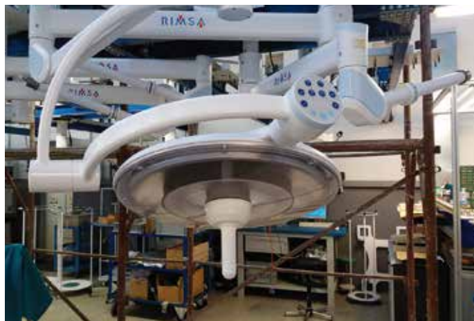
La nuova scialitica per Afagnan

Tutte le realizzazioni descritte in queste pagine sono possibili grazie a tanta gente che lavora in silenzio e con... generosità. Grazie!