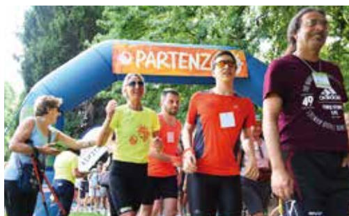
Il Mondo corre in Brianza, edizione 2018

Sabato 22 giugno , grande festa lungo il Lambro con la seconda edizione della marcia "Il Mondo corre in Brianza". Due percorsi affascinanti di 6 e 15 chilometri tra il verde con partenza alle ore 17.00 e arrivo alla residenza "Il Parco". Sul sito www.gsafrica.it tutte le notizie e gli aggiornamenti oltre alla modalità di iscrizione.