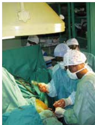
Sala operatoria dell'ospedale di Afagnan