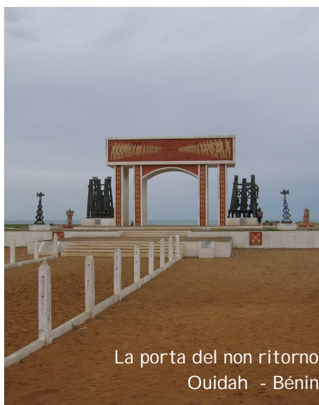
La porta del non ritorno Ouidah - Bénin

Nel contesto generale della globalizzazione il dialogo politico-istituzionale tra Europa e Africa non può prescindere dal superamento dei nazionalismi e dal confronto culturale. gsa