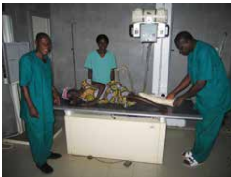
In Radiologia ad Afagnan