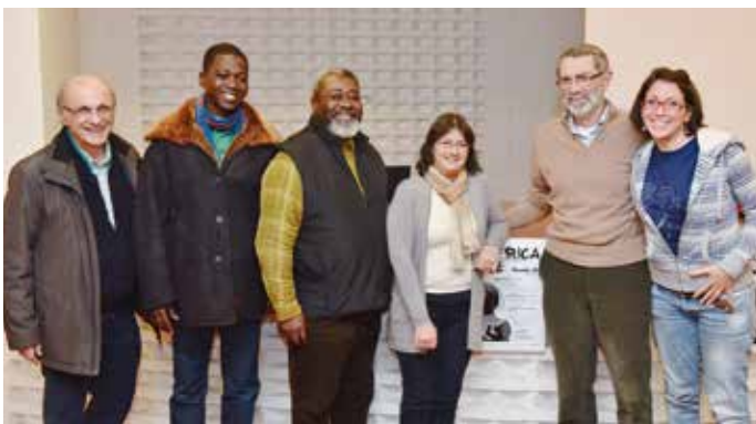
Kossi Komla Ebri, medico togolese, antropologo e scrittore