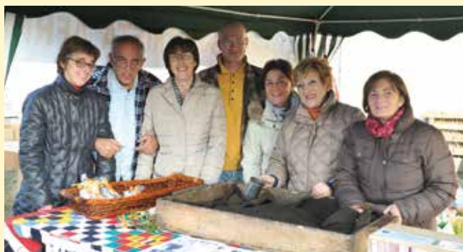
Castagne della solidarietà: il Gruppo Camosci

Sempre vivace la postazione delle caldarroste del GSA sul piazzale del cimitero di Seregno con la partecipazione di Alpini e Camosci; quest'anno è andato a ruba anche il gustosissimo pane dei morti.